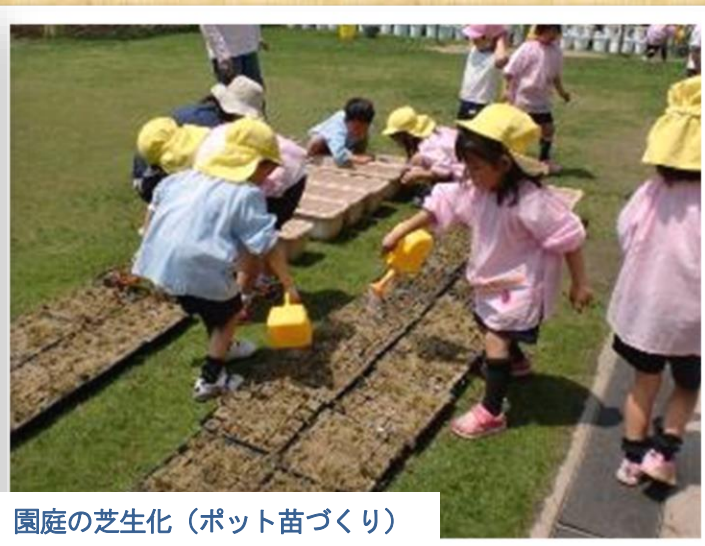
園庭の芝生化（ポット苗づくり）