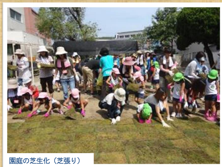
園庭の芝生化（芝張り）