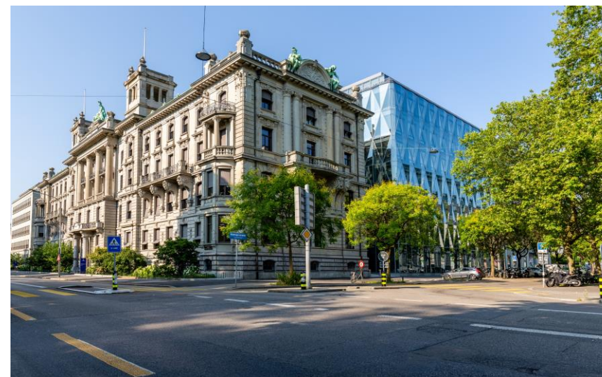
スイスのチューリッヒ・インシュアランス・グループ本社