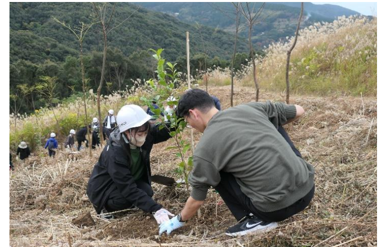
長崎県の「チューリッヒの森」での社員による森林整備活動

当社の社員も今年4月より間伐や枝打ち、下草刈り、自然観察などの活動を実施し、県と一体となって森林を守っていく