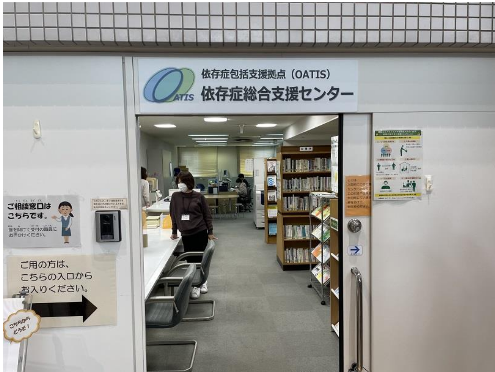
入口の天井方向には支援Cの標識があります。 必要に応じて移設をお願いします。