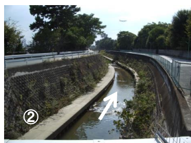
② 名神高速道路上流