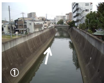
① 神崎川合流点付近