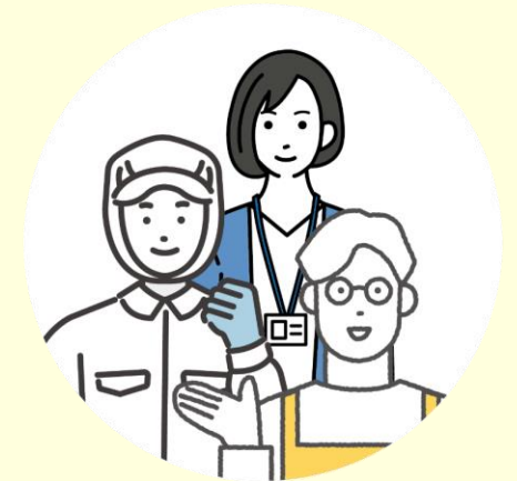
食品製造・卸・小売 生産者 外食産業