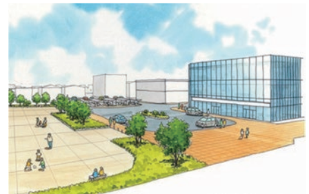
跡地整備イメージパース