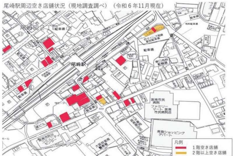
尾崎駅周辺空き店舗状況(現地調査調べ)(令和6年11月現在)