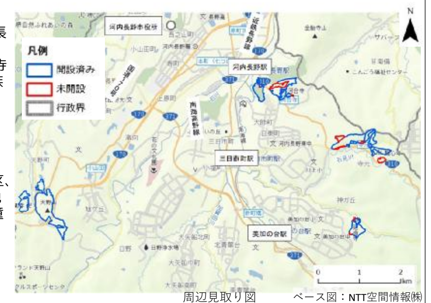
周辺見取り図 ベース図：NTT空間情報(株)