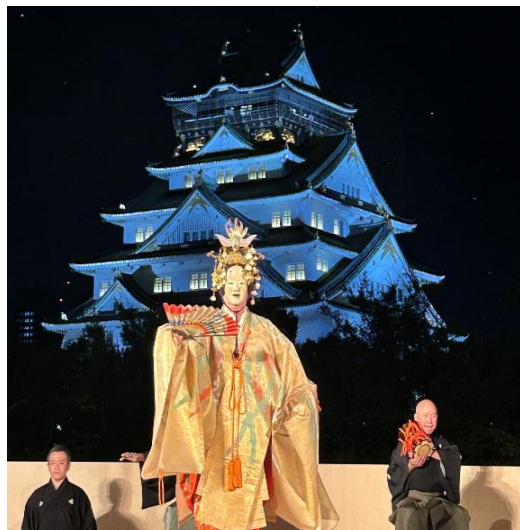
薪能（大阪城西の丸庭園で公演）