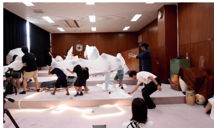
Equity&Justiceを軸としたソーシャルアート コーディネーターの育成（人材育成講座）