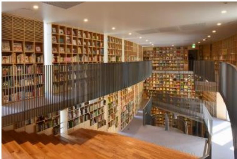
こども本の森中之島（内部）