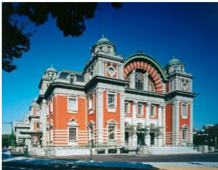
大阪市中央公会堂