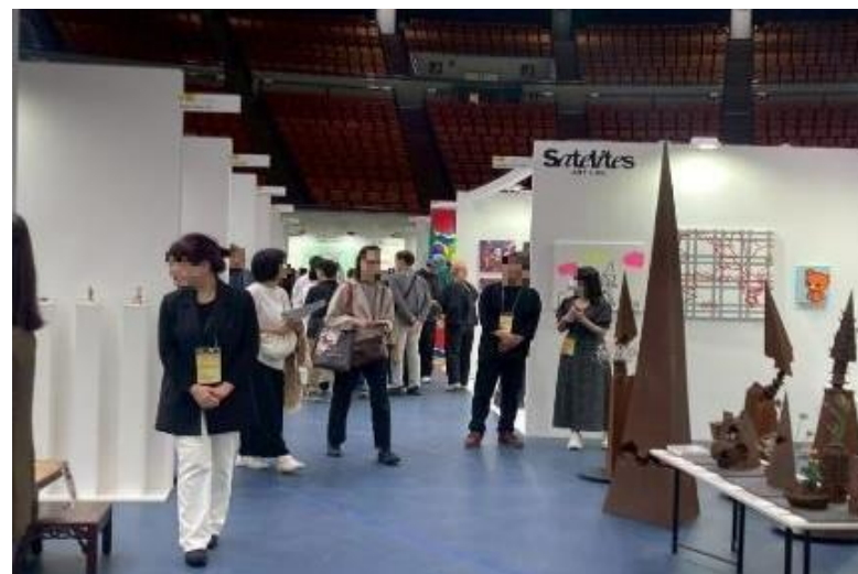
OSAKA INTERNATIONAL ART（大阪城ホールでのアートフェア）