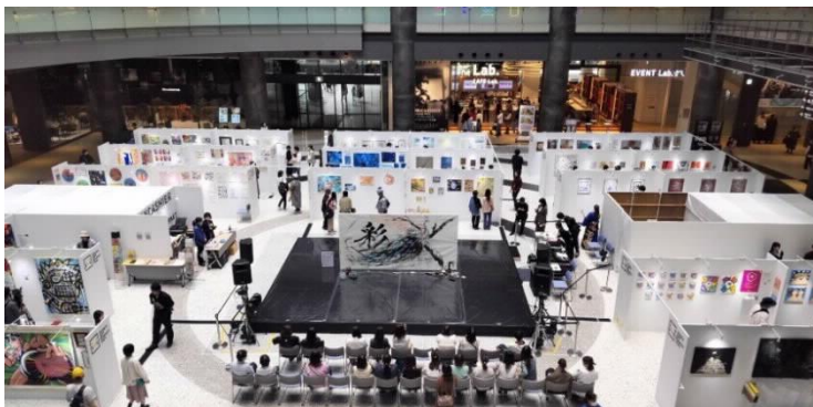
OSAKA ART MARKET（大阪で活躍するアーティストの作品を展示・販売）