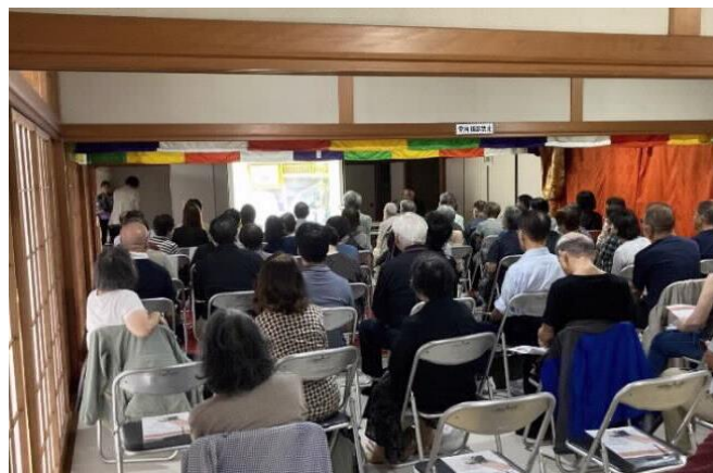
文学碑の集い（講演会）