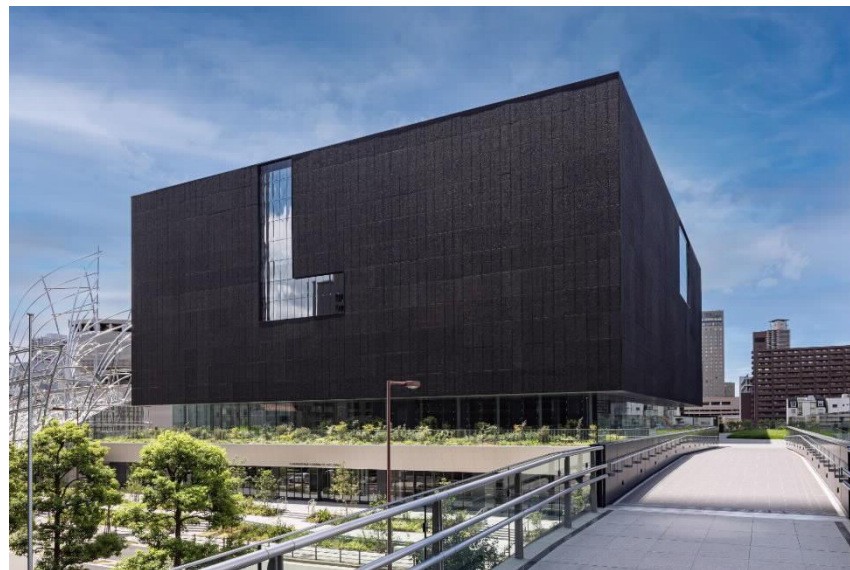
大阪中之島美術館