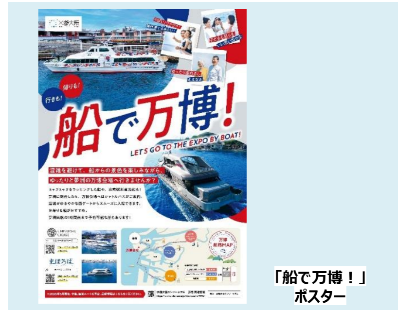
「船で万博！」 ポスター