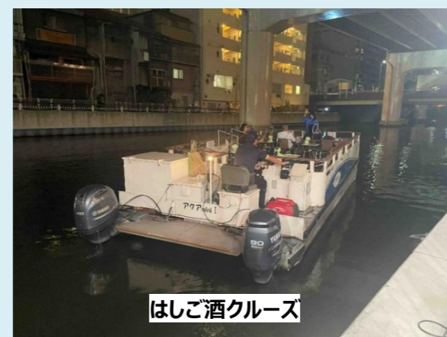
はしご酒クルーズ