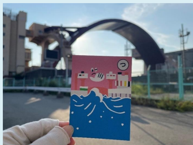
話題となった水都大阪からたデジタルスタンプラリー (NHKの情報番組「ほっと関西」で放映)