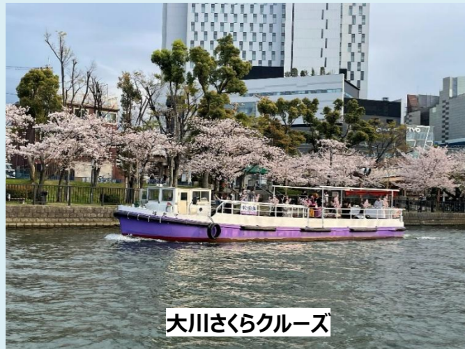
大川さくらクルーズ