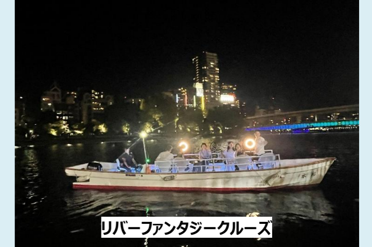
リバーファンタジークルーズ