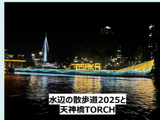
水辺の散歩道2025と 天神橋TORCH