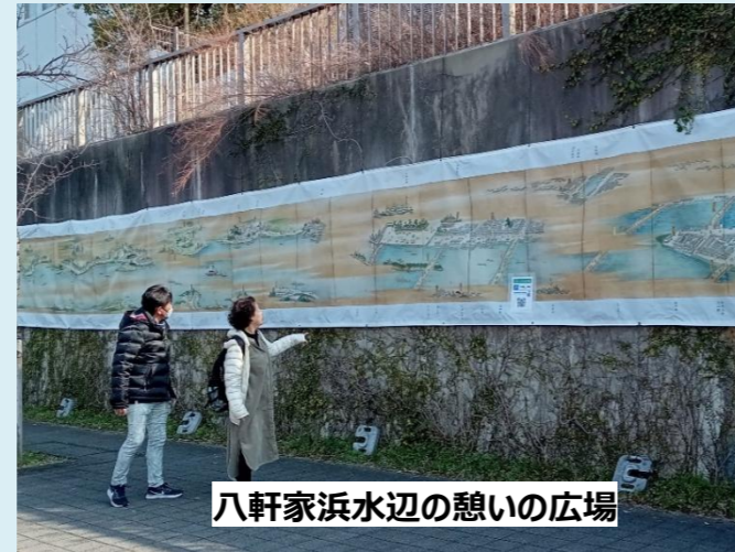
八軒家浜水辺の憩いの広場