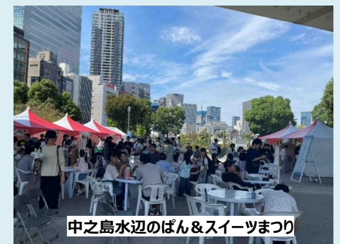
中之島水辺のぱん&スイーツまつり