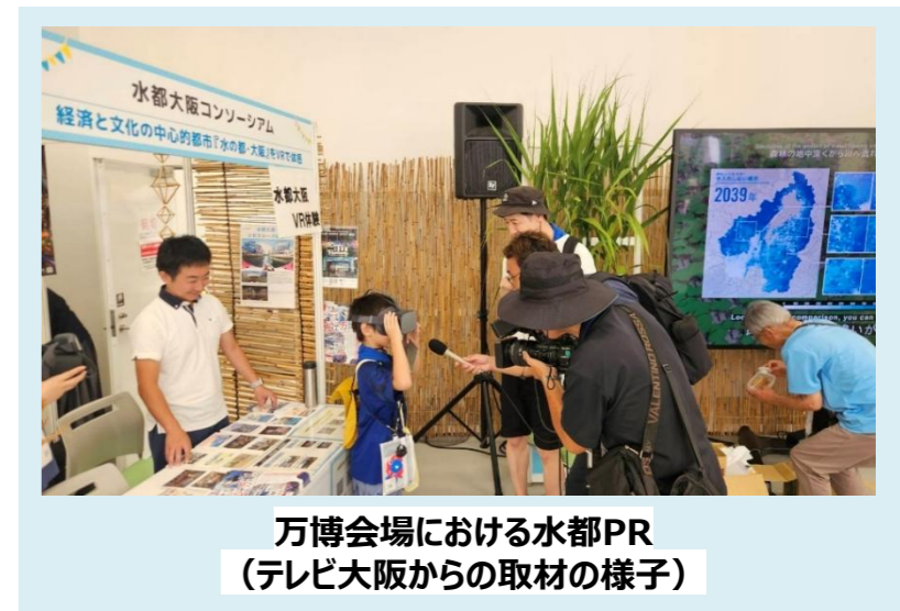
万博会場における水都PR (テレビ大阪からの取材の様子)