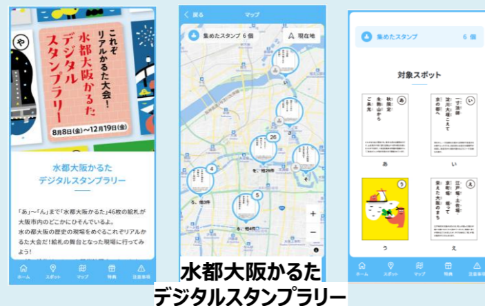
水都大阪かるた デジタルスタンプラリー