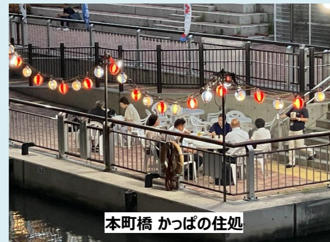
本町橋 かつぱの住処