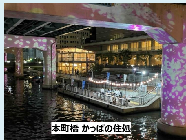
本町橋 かっぱの住処