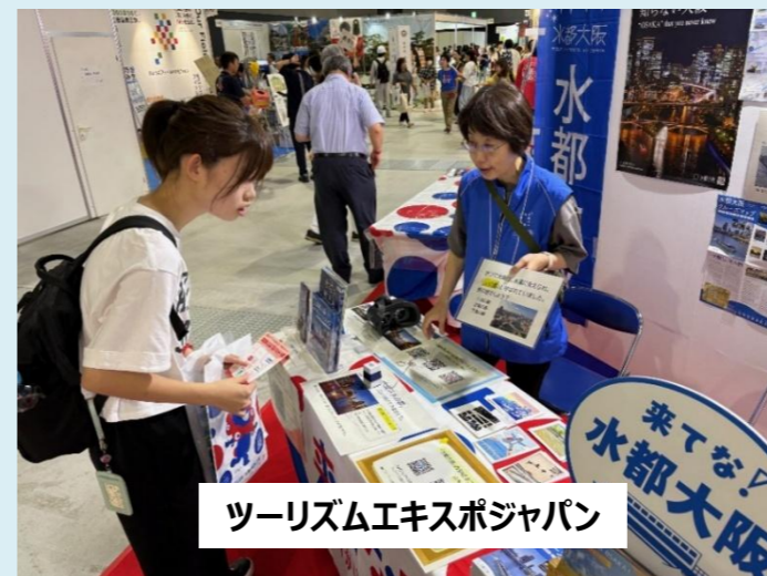
ツーリズムエキスポジャパン