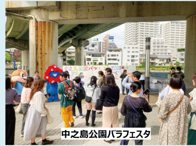
中之島公園バラフェスタ