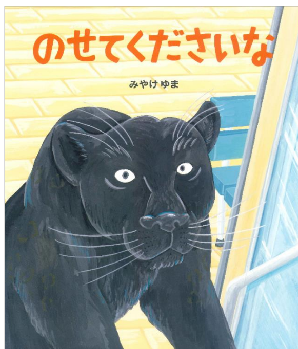
『のせてくださいな』 作：みやけゆま B L 出版