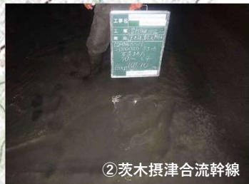
②茨木摂津合流幹線