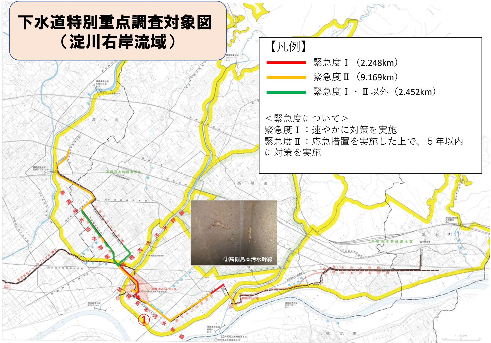
①高槻島本污水幹線