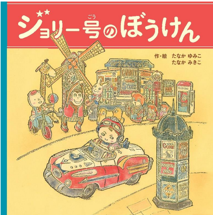
『ジョリー号のぼうけん』 作・絵：たなか ゆみこ たなか みきこ 出版ワークス （7月発売予定）