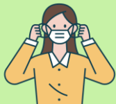
Đeo khẩu trang

Hãy cẩn thận không ho hoặc hắt hơi vào những người xung quanh bạn.