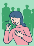
將臉轉向 他人以外的方向