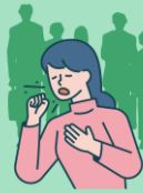
주변 사람들과 얼굴을 멀리한다