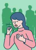
ไม่หันหน้าเข้าหา คนรอบข้าง