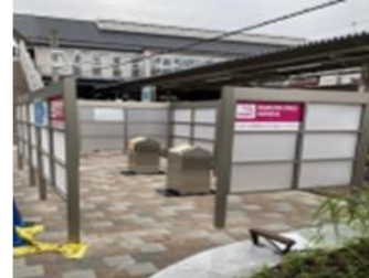
(2)屋外設置(パーティション型)