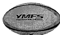
タグラグビーセット (60 団体:対象は小学生以下)