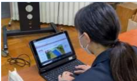
【写真 2】スライド作成の様子