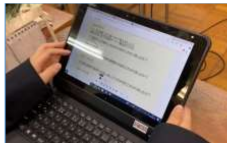
【写真 3】ふりかえりカードを記入する生徒