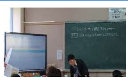
【写真 3】 「ふり返し」をスプレッドシートに記入する。