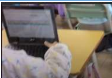
【写真 1】 本時の「めあて」をスプレッドシートに入力し、クラスで共有する。