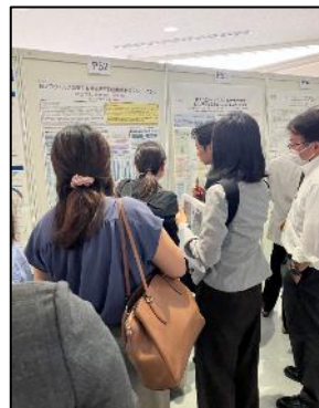
第44回日本食品微生物学会 学術総会での発表