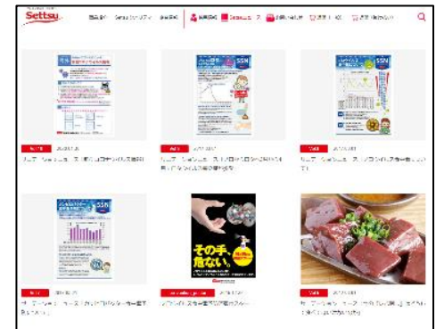
Settsuニュース（同社サイト）