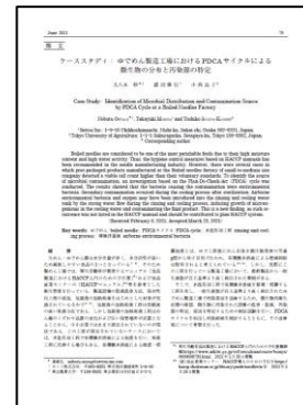
食品衛生学雑誌、掲載論文