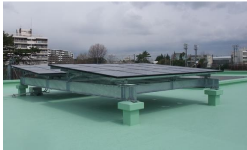
【太陽光パネルの設置】