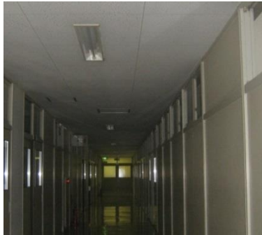
【支障のない範囲で廊下の消灯】