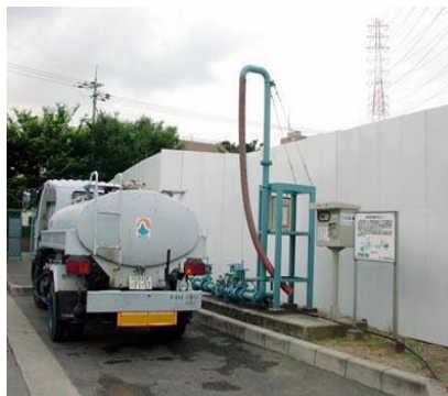
【下水処理水の有効活用～「Q水くん」】