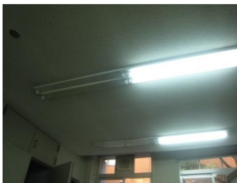
【執務室の部分消灯】