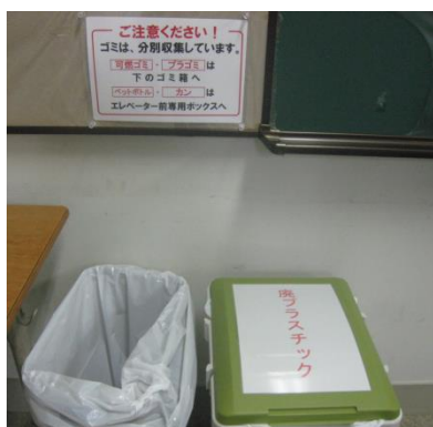
【ごみ分別の呼びかけ】