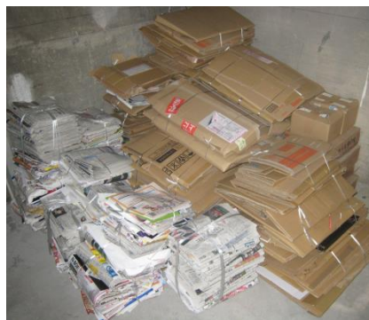
【古紙リサイクルのための分別収集】