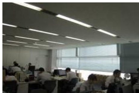
【ブラインドの活用】