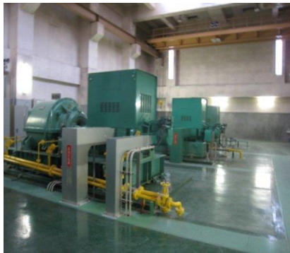
【水みらいセンター 棟内の照明】