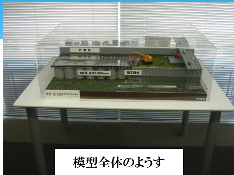
模型全体のようす