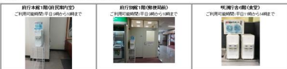
府ホームページ 給水場所