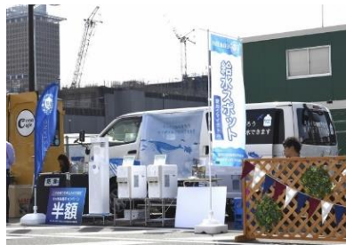
レッツゴー万博2025@大阪城公園(R元.11.16)