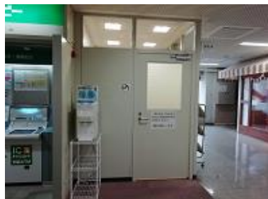
府庁別館1F 無料給水スポット