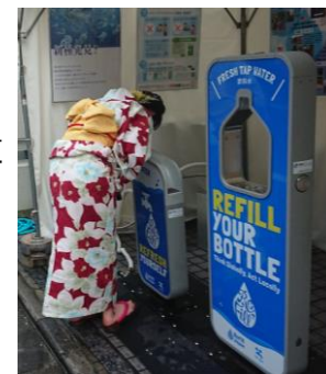
天神祭における給水スポット設置