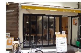
給茶スポット（象印ホームページ）