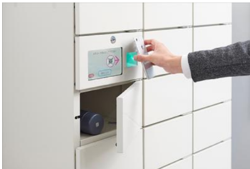
『ZOJIRUSHI MY BOTTLE CLOAK』 URL: https://www.my-bottle-cloak.com/

本取り組みを通じて、マイボトルユーザーが不満に思われている「持ち運びの重さ」や「飲み物の準備」「使用後の洗浄」といった手間を無くし、マイボトル（リユース容器）の継続利用、および新規ユーザー獲得を促進することで、循環型社会の実現を目指します。