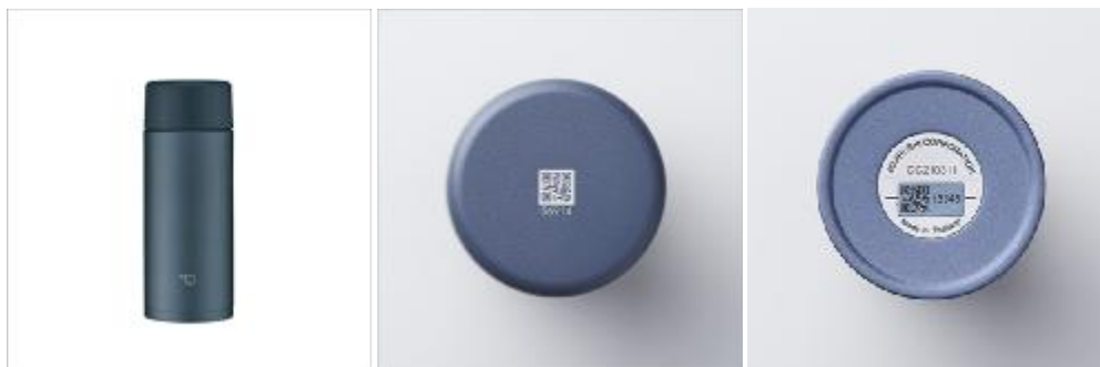
左より、製品本体、ふた（天面）、本体底面

なお、実証実験期間中はLINE公式アカウント内（ドリンクやフードを購入）で使用できる2,000円分のポイントを進呈いたします。