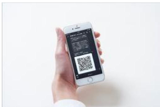
注文後にQRコードが送付される様子