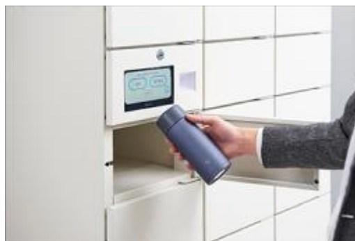
ロッカーでマイボトルを受け取る様子