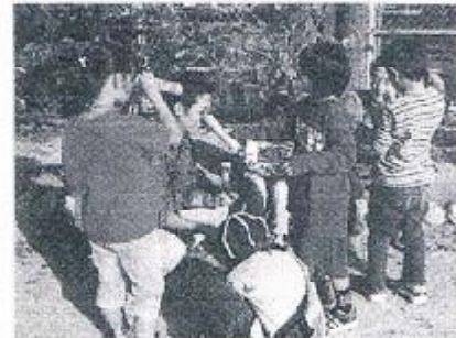
作った万華鏡で遊ぶ様子