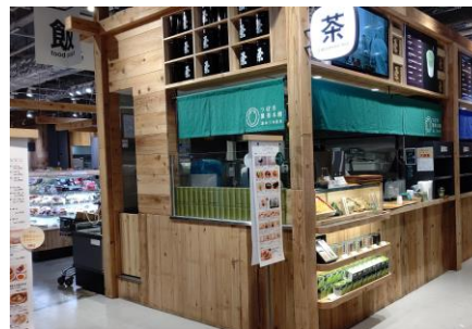
給茶スポット (茶寮つば市製茶本舗 NODATE)