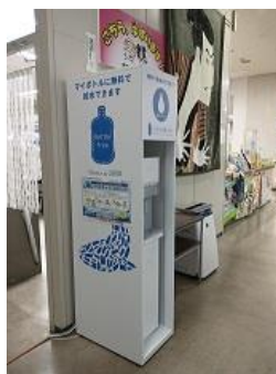
泉大津市役所 1階 無料マイボトルスポット