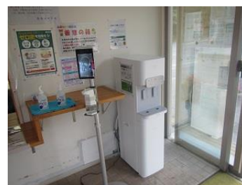
熊取町 永楽墓苑・永楽ゆめの森 公園管理棟 無料マイボトルスポット