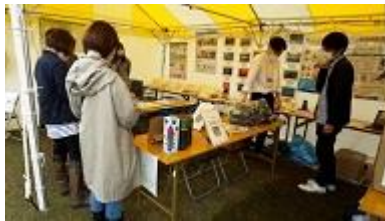
ロハスフェスタ万博における出展 (R4.4.23~24)

〈BRITA・MIクリエーションズ・タカ・象印・ウォーターネット・ウォータースタンド・ピーコック〉