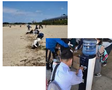
ブルーオーシャン作戦 潮干狩りの前に、みんなで「プラ干狩り」(R4.4.16)