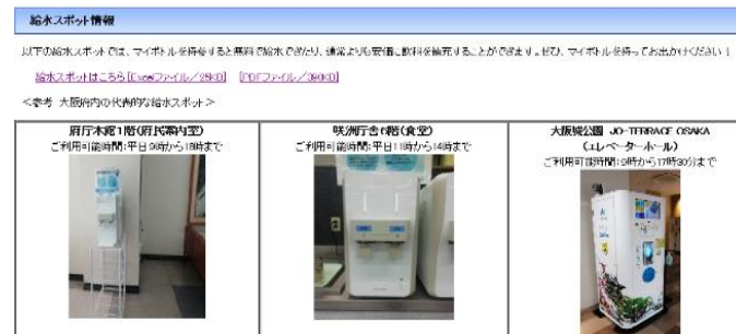
府ホームページ マイボトルスポット

（上）マイボトルスポットを公表することにより、各種マイボトルマップの登録をすすめます。 （左）マイボトルスポット名や場所、利用可能時間などが一目でわかります。