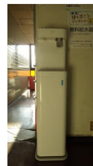
島本町本庁舎 1階（税務課前） 無料マイボトルスポット