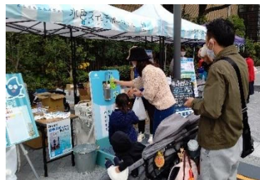
中之島モダンシーン (R3.11.21)

マイボトルスポットの設置、ステンレスボトル・ボトル型浄水器の展示およびマイボトル啓発ブースの設置