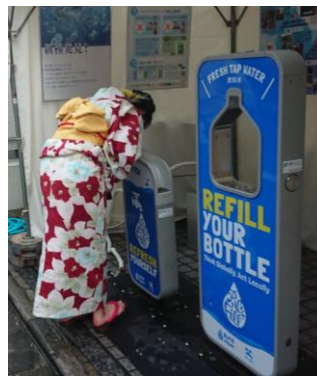
天神祭におけるマイボトルスポット設置