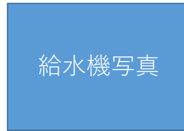
熊取町〇〇（設置場所名） 無料マイボトルスポット