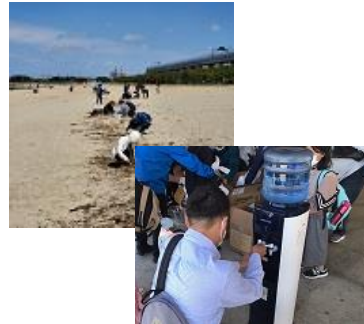
ブルーオーシャン作戦 潮干狩りの前に、みんなで「プラ干狩り」(R4.4.16)