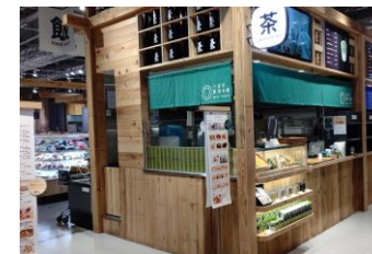
給茶スポット (茶寮つば市製茶本舗NODATE)