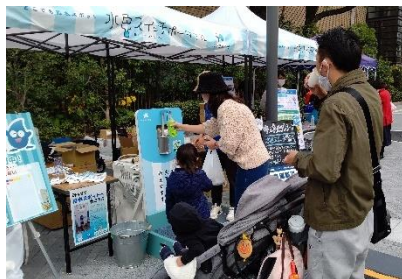
中之島モダンシーン (R3.11.21)

マイボトルスポットの設置、ステンレスボトル・ボトル型浄水器の展示およびマイボトル啓発ブースの設置