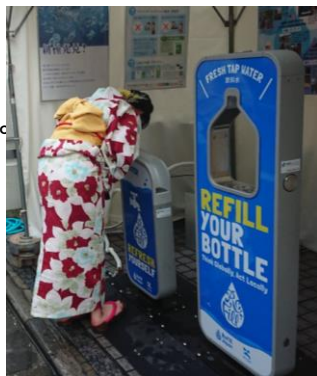
天神祭におけるマイボトルスポット設置