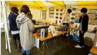
ロハスフェスタ万博における出展 (R4.4.23~24)

〈BRITA・MIクリエーションズ・タカノ・象印・ウォーターネット・ウォータースタンド・ピーコック〉