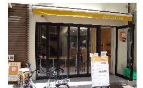
給茶スポット（象印ホームページ）