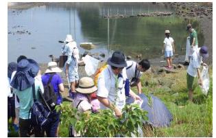
大阪湾エコバスツアー (R元.8)

親子を対象とした大阪湾における海洋プラごみ学習の実施。参加者に対し、マイボトルをプレゼント