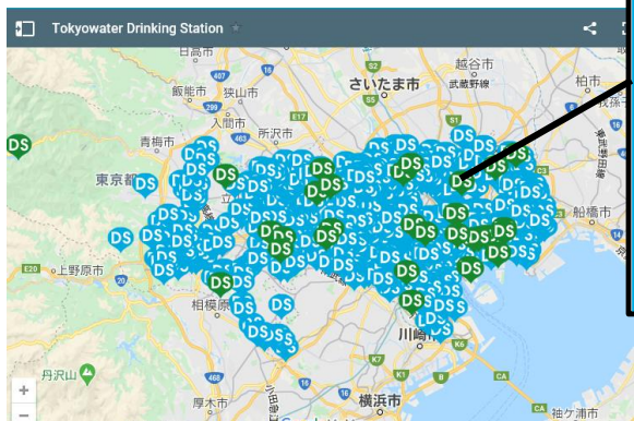
東京都水道局 給水マップ