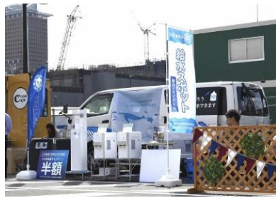
レッツゴー万博2025@大阪城公園(R元.11.16)