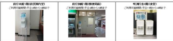
府ホームページ 給水場所