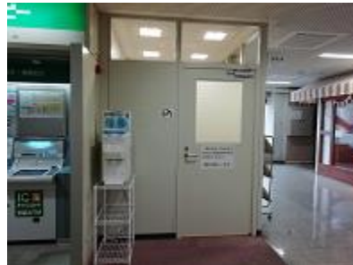
府庁別館1F 無料給水スポット