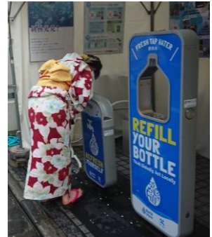
天神祭における給水スポット設置