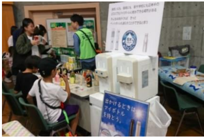
啓発ブース@ECO縁日(R元.11.3)

給水機の水で、香りのついたフレーバー水を参加者がつくって、マイボトルへの給水を楽しんでもらうコーナーを設置