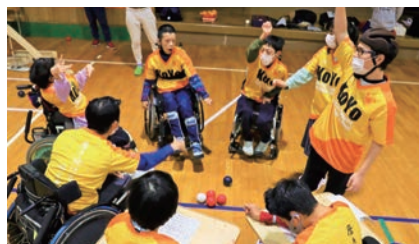
府立光陽支援学校