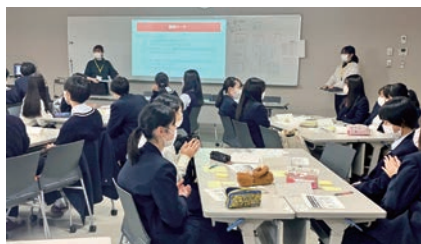
府立吹田東高等学校