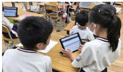
守口市立さつき学園