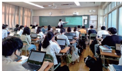
府立夕陽丘高等学校