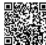
▲省エネ通知のページQRコード