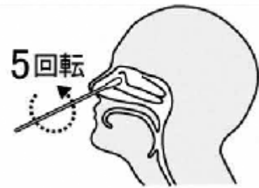
鼻腔ぬぐい液採取