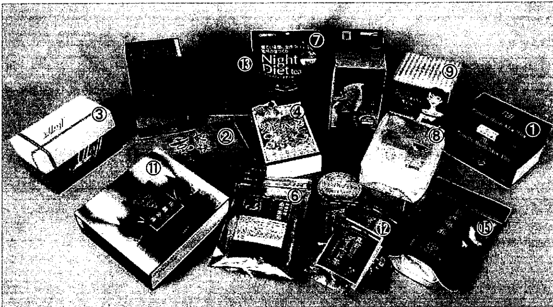
写真2. テスト対象銘柄

インターネットの通信販売及び大手ドラッグストア等で購入可能な銘柄を中心に、「キャンドルブッシュ」「ゴールデンキャンドル」「ハネセンナ」「カシミア・アラタ」が原材料一覧の上位に記載されているティーバッグタイプの健康茶15銘柄をテスト対象としました（写真2、表1）。