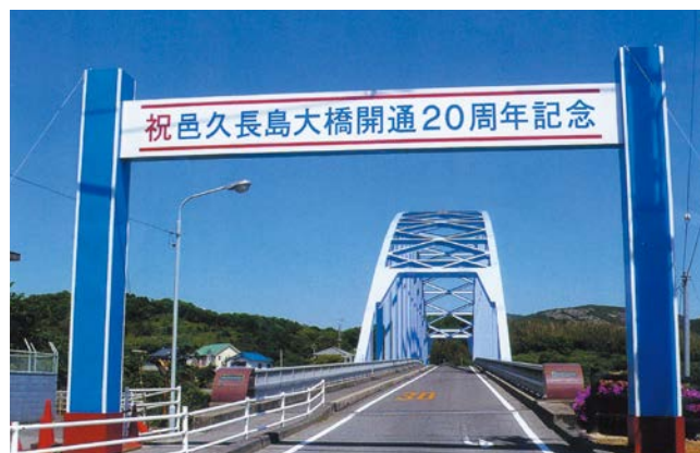
人間回復の橋と呼ばれる邑久長島大橋

長島と対岸の虫明を結ぶ邑久長島大橋は、1988年(昭和63年)に開通しました。隔離する必要のない証、人間回復の証として架橋され、現在は民間バスも乗り入れ、入所者も自由に島外に出かけられるようになっています。