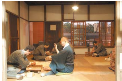
昔の療養所の暮らしが再現されています

〒189-0002 東京都東村山市青葉町4-1-13 電話 042-396-2909 URL https://www.nhdm.jp/