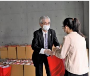
（食支援プロジェクト配布当日の様子）