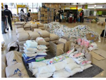
（1回目の食料支援事業の配布当日の様子。 米は7 t、キャベツは540個を受入れ）