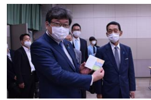
（左図：学生 食堂における 間仕切り）