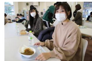
（学生応援ランチを 食べる学生）