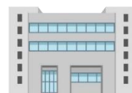
府教育庁(支援教育課)