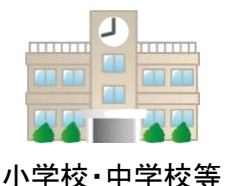
小学校・中学校等