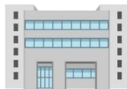
府教育庁(高校教育改革課)