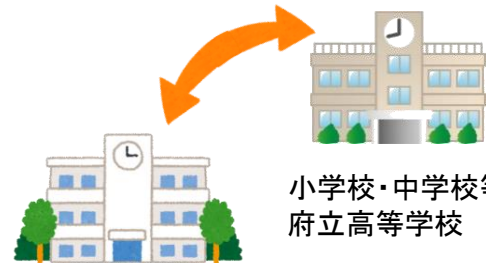
小学校・中学校等 府立高等学校