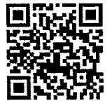
気象庁ホームページ