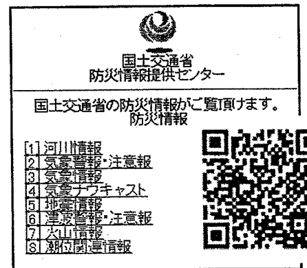
防災情報提供センター 携帯端末向けホームページ (Top)