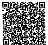
火山登山者向けの 情報提供ページ

(噴火速報の説明： https://www.data.jma.go.jp/svd/vois/data/tokyo/STOCK/kaisetsu/funkasokuho/funkasokuho_toha.html )