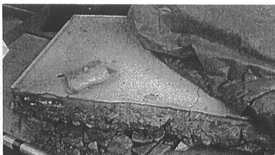
落下した庇（重さ約800kg）