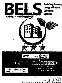
[図1] ガイドラインに基づく第三者認証の例

また、ダイヤモンドリスponsに対応した時間帯別・季節別の電気料金メニューが選択できる場合はその活用に努めるとともに、エネルギー管理システム（BEMS・HEMS等）の導入により、ビルの運用方法、住宅の住まい方の改善によるピーク対策及び省エネルギーに努めること。