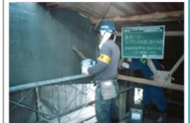
(下) 鉄筋コンクリートの長寿命化工事 (中性化対策)