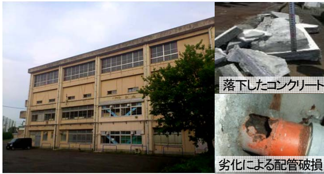
落下したコンクリート

公共施設の約4割を占める学校施設のうち、公立小中学校施設については 建築後25年以上を経過した建物が保有面積の約7割 を占めるなど、老朽化が深刻。国・地方とも厳しい財政状況の下、 限られた予算でできる限り多くの学校について、安全面や機能面の改善を図ることが喫緊の課題。