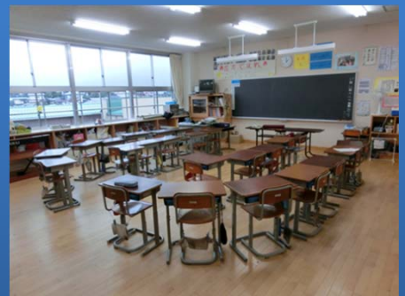
内装木質化により明るく暖かみのある教室に改修した事例