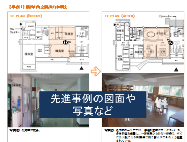
先進事例の図面や写真など