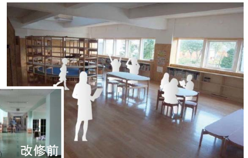
改修に併せて多目的に活用できるワークスペースを整備