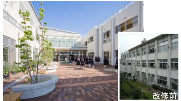
環境に配慮した学校施設として再生