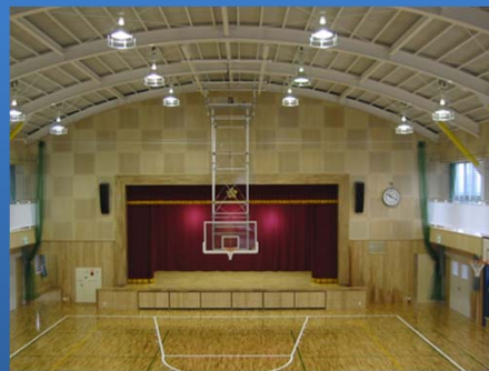
屋内運動場を地域の防災拠点として再生した事例