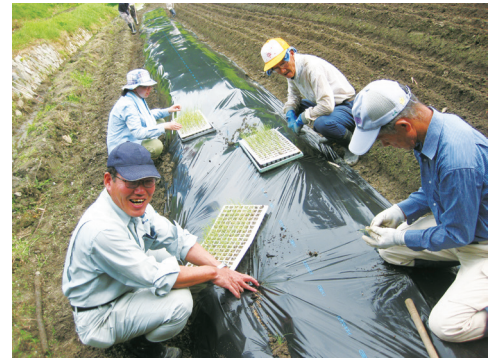
▲新規就農者への栽培指導（ねぎ）

※1 認定新規就農者とは、新たに農業を始めるにあたり作成する青年等就農計画について市町村の認定を受けた方のこと。上記資金の交付や融資の優遇などの支援施策の対象となる。