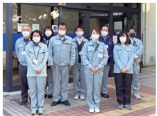
▲普及事業に取り組む農の普及課職員等

国連では、2030年までの国際目標として「持続可能な開発目標(SDGs)」が2015年に策定されました。北部農と緑の総合事務所 農の普及課の活動はSDGsに掲げる17のゴールのうち、右図のゴールの達成に寄与するものです。