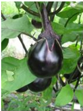
▲収穫間近の鳥飼茄子

摂津市で栽培されているなにわの伝統野菜「鳥飼茄子」。生産量が少なく「幻のなす」とも言われている「鳥飼茄子」ですが、果皮が柔らかく、肉質が緻密で、独特の甘みとうまみがあり、味も格別です。