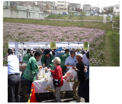
▲れんげ畑とフェアの様子

当事務所では、昨年からJA、市と連携して「れんげ」の空中チッソ固定機能に着目し、後作の水稻で化学肥料（チッソ成分）の施用量を減らす栽培に取り組んでいます。これは、長年、景観形成作物として吹田市民から愛され、時には子どもたちが花摘みを楽しむ水田裏作の「れんげ」栽培をさらに発展させるものです。特に、市街化区域内農地では、周辺環境に配慮した「環境にやさしい農法」が農業の継続に繋がります。