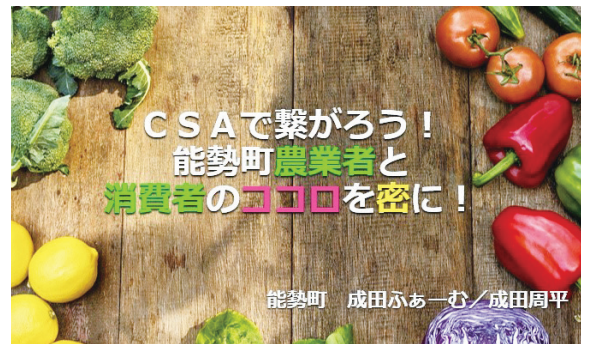
▲ No-1グランプリ(R3.1.23開催)発表スライド