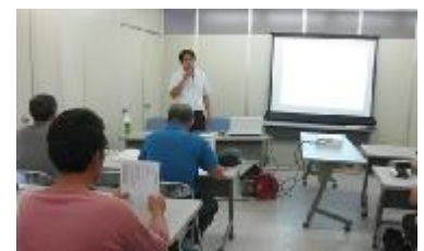
▲能勢町での講習会風景

また、8月27日(火)にはJA たかつきの直売所出荷者向け講習会の中で、農の普及課がハウスの補強方法について講習を行いました。今後も、災害への備え等に関する講習会を開催し、農業経営の安定を推進していきます。