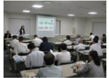
▲豊中市での講習会風景

販売促進に取り組む際は、①安心・安全、②美味しいこと、③価格、④ブランド、そして、⑤消費者に伝えたい想い、の5つのポイントを常に考えておく必要があることなどの説明を受けました。