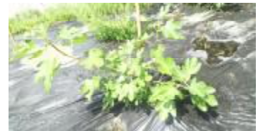
▲1年目のいちじく（9月）