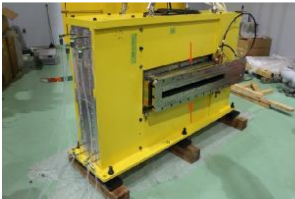
図2-1：高周波加速空洞《主リングから取り出した状態》（平成27年6月15日撮影） 図中の赤矢印の部分（背面側を含む）計4箇所 に磁場補正電磁石が組み込まれている。