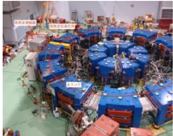
図1-2：イノベーション・リサーチ・ラボラトリー 実験装置室全景 （平成27年4月24日撮影）