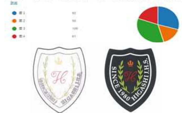
投票で選ばれたエンブレム