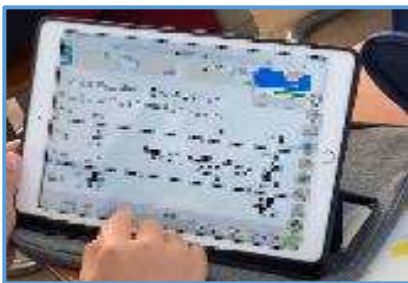
デジタル教科書に答えを書き込みたいと思ったことも書き込む場面