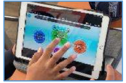
学習アプリを使用し、自分に合ったコースを選び、知識の定着を図っている場面