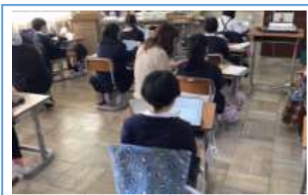
2年生になってできるようになったことをスライドにまとめている場面