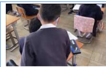
友達のスライドを見て、作成方法の工夫を教えてもらっている場面