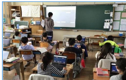
写真2：児童の意見を並べて比較している場面（児童の端末にも画面を配信している）