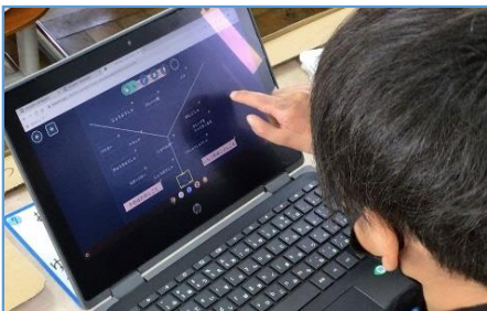
写真1：Yチャートで様々な自動車を仕事別に分類する場面